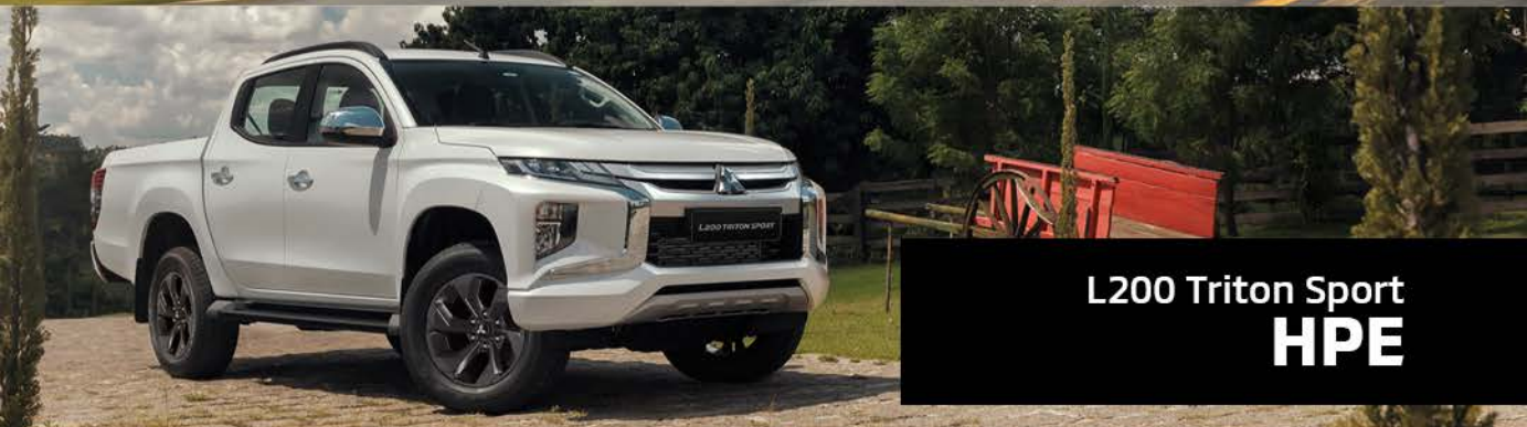
L200 Triton Sport HPE