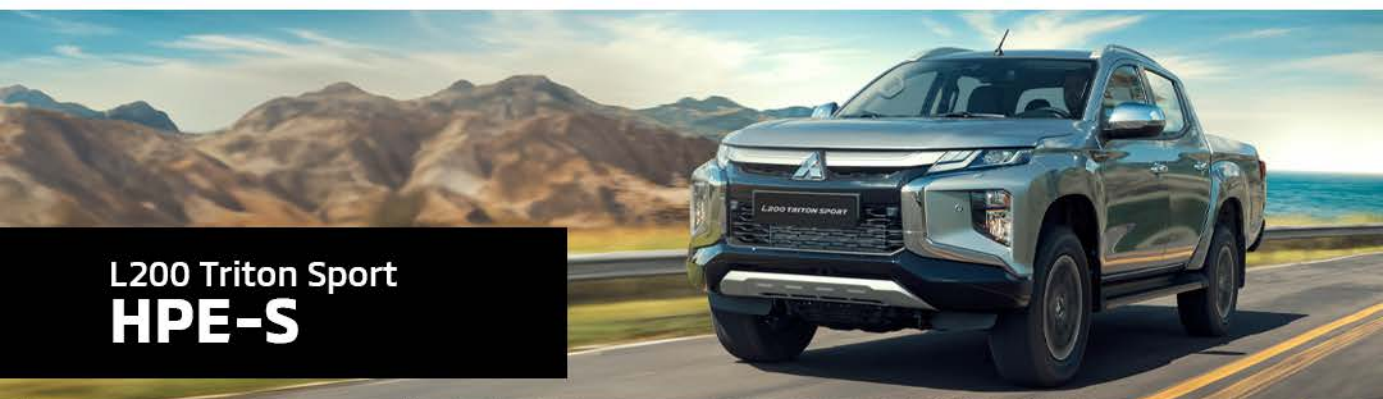
L200 Triton Sport HPE-S