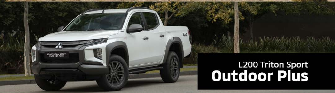
L200 Triton Sport Outdoor Plus