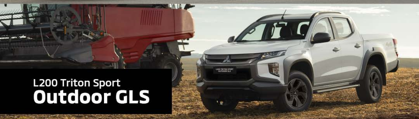
L200 Triton Sport Outdoor GLS