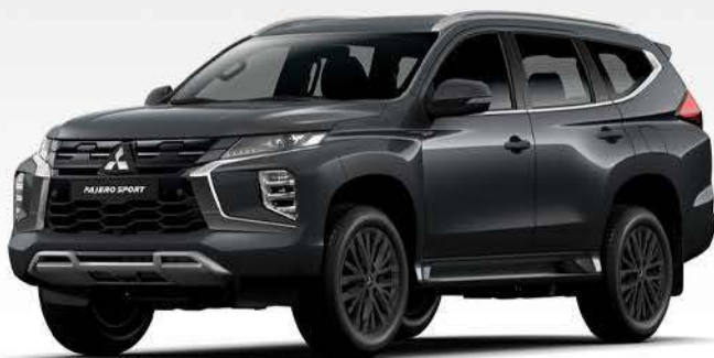
Pajero Sport Legend