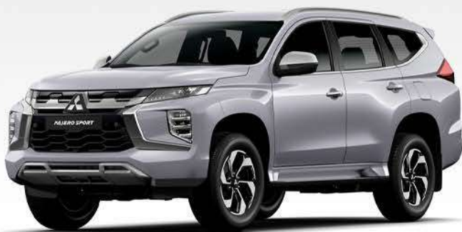
Pajero Sport HPE