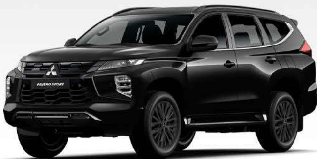
Pajero Sport Legend Black